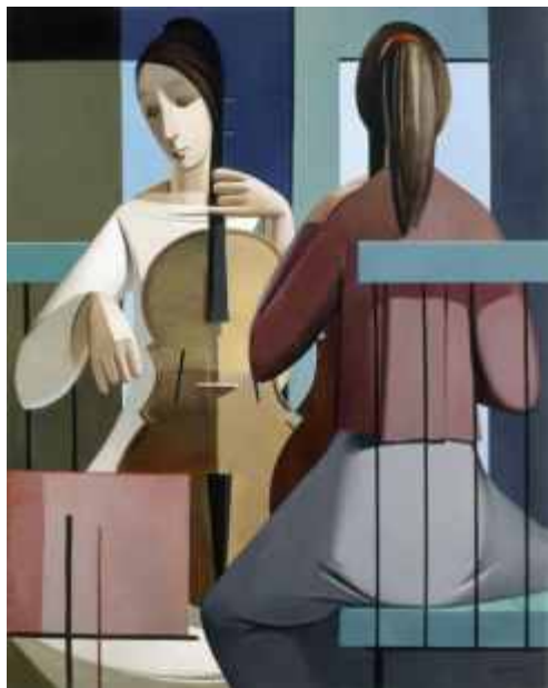
VAR. SONATA III (N° 953). 55 x 70 cm. Ed: 50 ej.