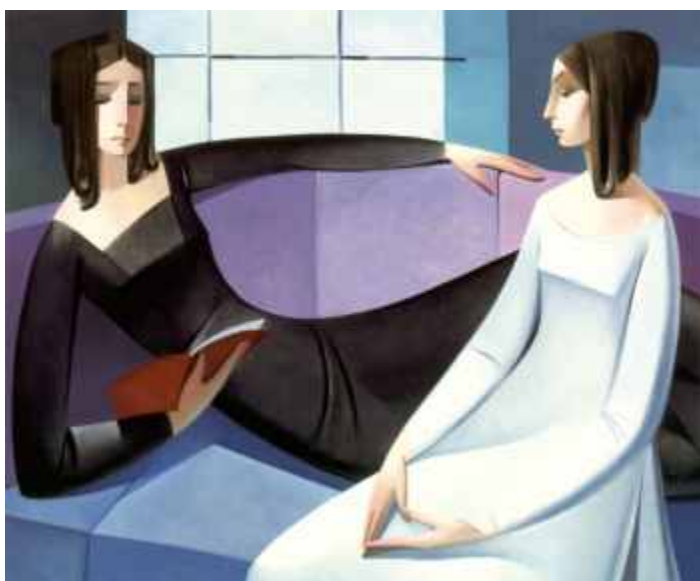
LO MEMORABLE (N° 807). 85 x 110 cm. Ed: 25 ej.