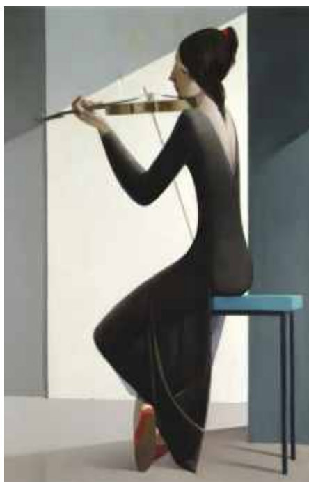
ADAGIO VAR. (N° 940). 90 x 55 cm. Ed: 25 ej.