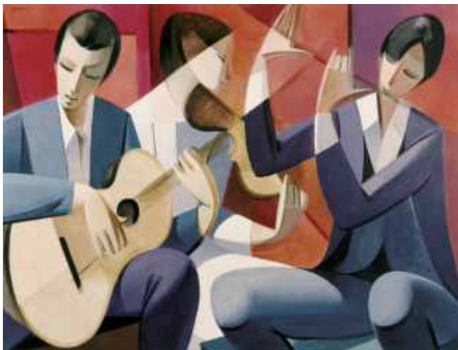
TRIO N° 4 (N° 769). 55 x 70 cm. Ed: 50 ej.