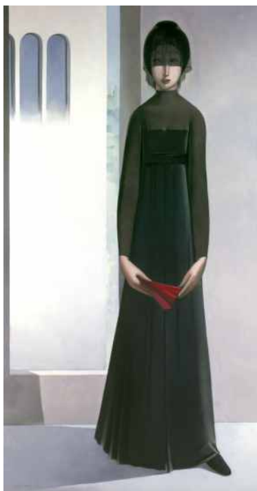
ANDALUCIA (N° 975). 100 x 55 cm. Ed: 25 ej.