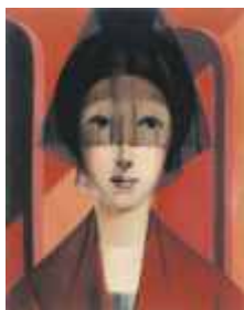
EST. ANDALUCIA (N° 980). 45 x 35 cm. Ed: 75 ej.