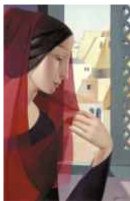
LUZ DE JERUSALEN (N° 856). 50 x 35 cm. Ed: 75 ej.