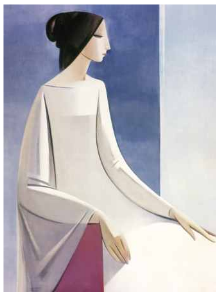
BLANCOR MEMORABLE (N° 718). 90 x 75 cm. Ed: 25 ej.