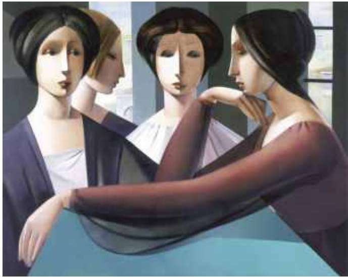
EVOCAION LATINA (N° 898). 55 x70 cm. Ed: 50 ej.