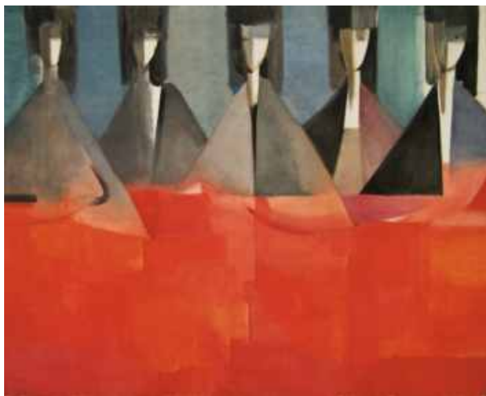
EN ESPERA (N° 461). 75 x 90 cm. Ed: 25 ej.