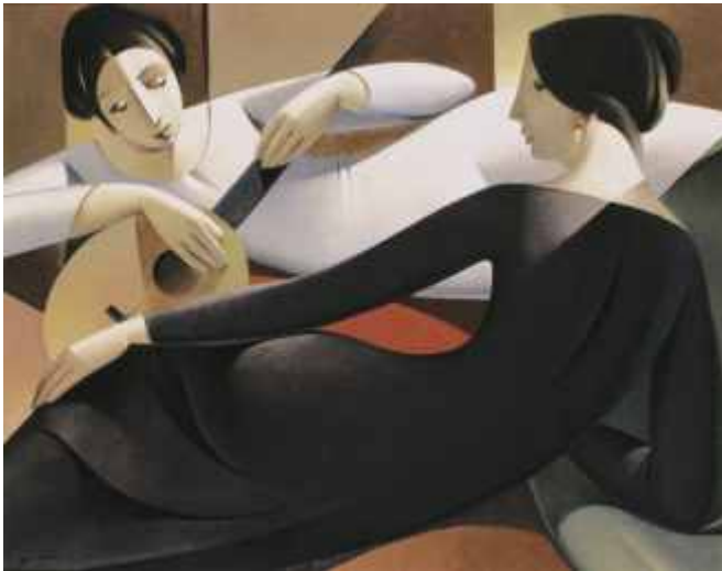
HOMENAJE A LA MUSICA (N° 882). 55 x 70 cm. Ed: 50 ej.