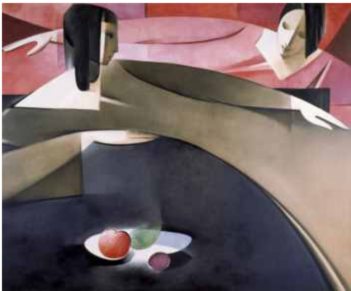
PROGRESION RITMICA (N° 789). 75 x 90 cm. Ed: 25 ej.