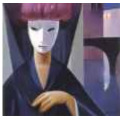
MASCARA VENECIANA (N° 960). 40 x 40 cm. Ed: 75 ej.