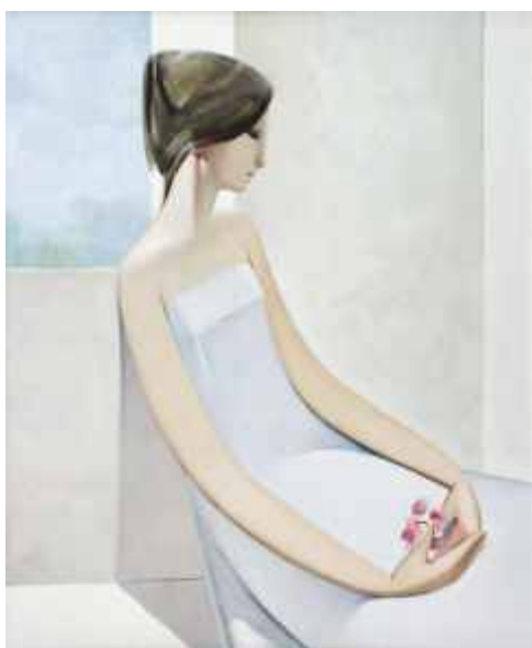
LUZ ANCESTRAL (N° 820). 70 x 55 cm. Ed: 50 ej.